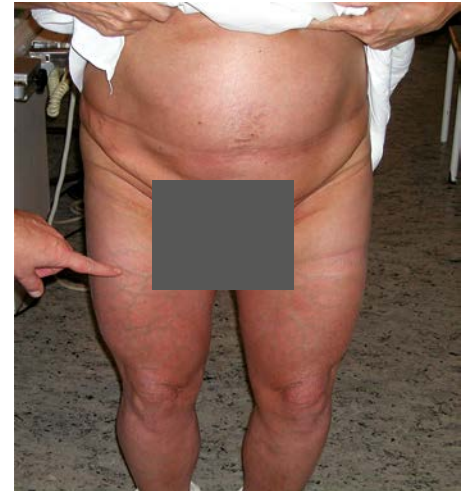
Obr. 4. Verrucosis lymphostatica